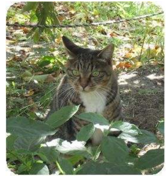
現場に現れたネコ