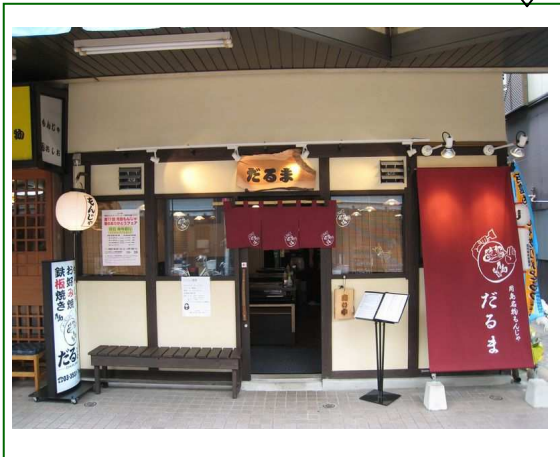
「月島名物もんじゃ だるま」様 中央区月島3-17-9(西仲通り四番街) TEL:03-3531-7626 定休日:月曜