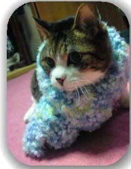
寒い日にマフラーをして。